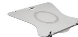
Notebookhalter-Platte Artikelnummer: 795+9169+000

Notebookplatte, 288x404mm, zur Montage an die TFC Ablage Faltarme