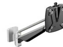
SlatWall Clu Arm I Artikelnummer: 990+1079+000

Eleganter 1-teiliger Monitortragarm mit Gasdruckfeder, für Monitore bis ca. 27 Zoll, Monitorbreite ca. 600 mm, Monitorgewicht 2 - 7 kg, Reichweite 314 mm