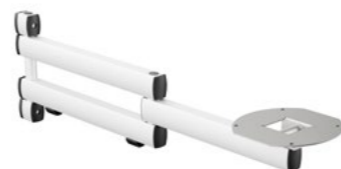
TFC Ablage Faltarm III 330-275 Artikelnummer: 969+3029+000

TFC Ablagearm mit einer Kapazität von max. 15Kg, zur Nutzung mit Tastatur- oder Notebookplatte